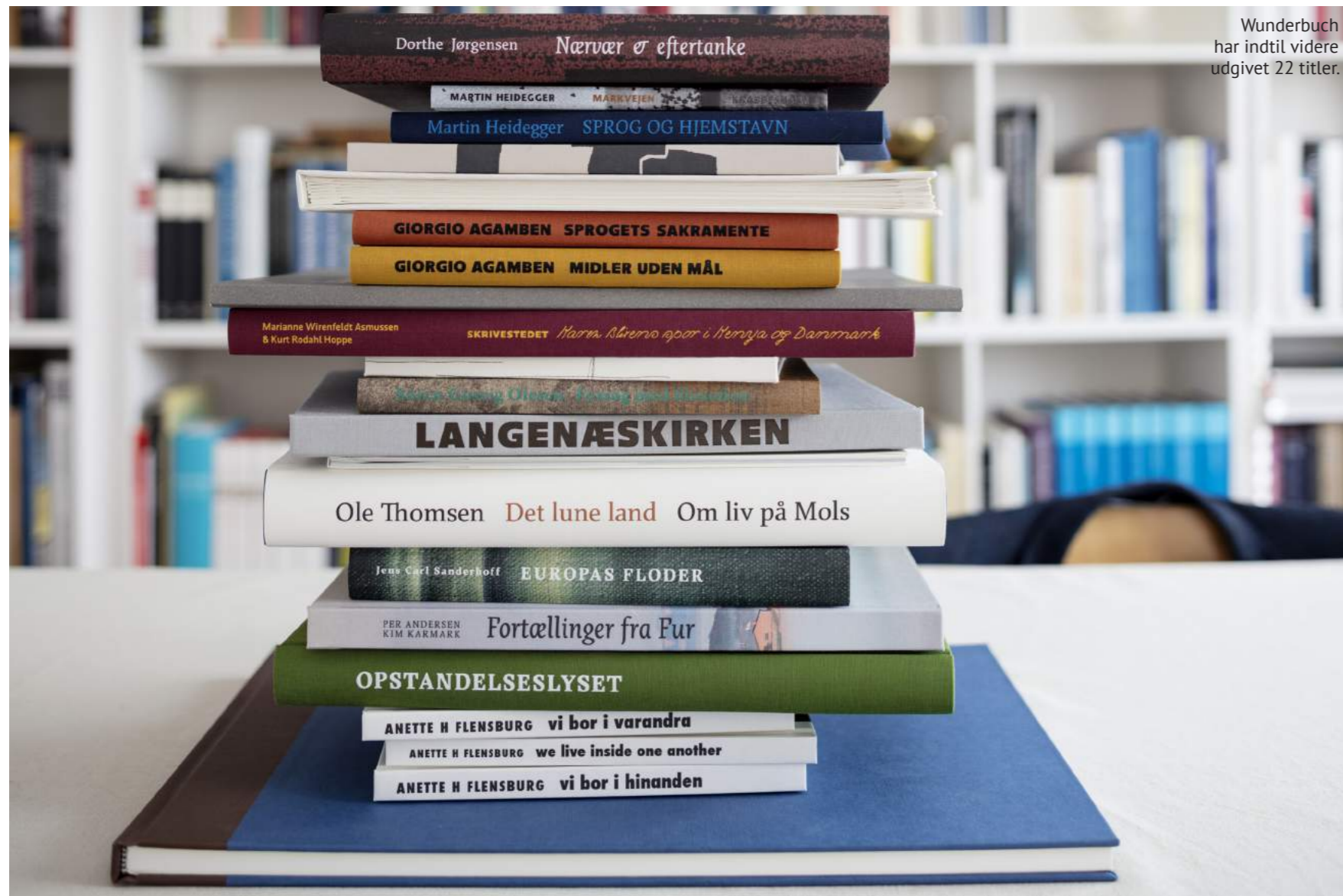
Wunderbuch har indtil videre udgivet 22 titler.

hans jobsøgende øje nummeret til det lokale Thise Mejeri, som helt tilfældigt manglede en ekstra mand i osteriet. Til at lave ost kort og godt.