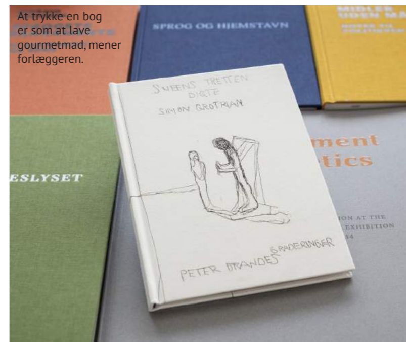
At trykke en bog er som at lave gourmetmad, mener forlæggeren.